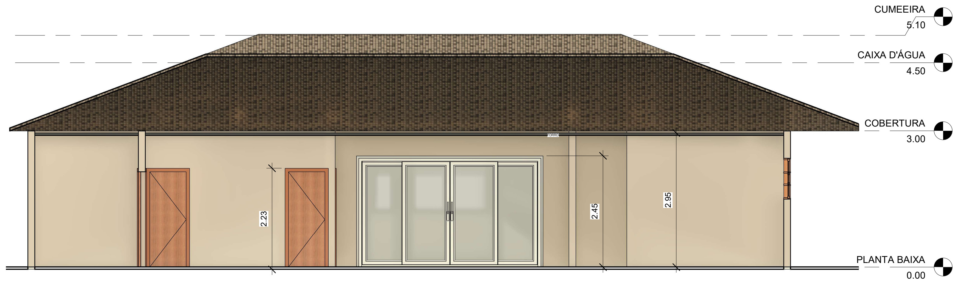
1 Corte 1 1 : 50