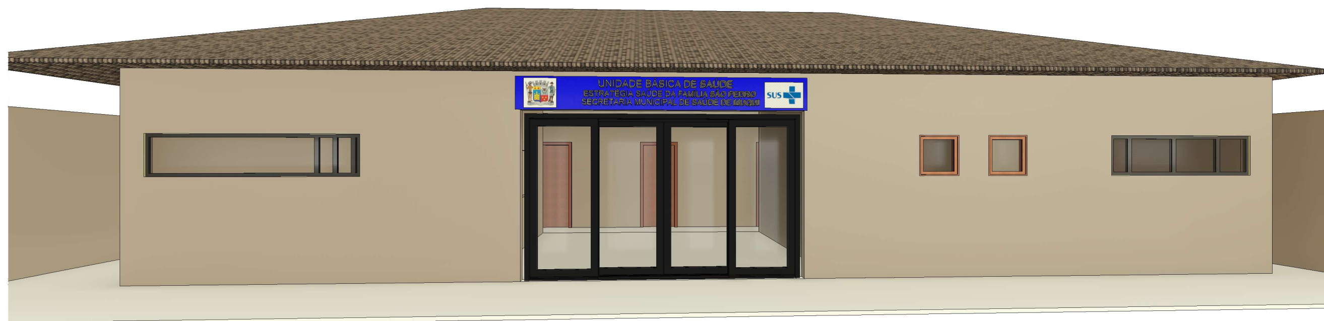
3 Vista 3D 2